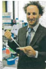
4 Patente: R. Schwarzenbacher

Lukrative Angebote aus der Privatwirtschaft lehnt er konsequent ab: 60 Publikationen, darunter Beiträge für Nature und Cell , sowie vier Patente zeigen, dass er weiß, was er tut.